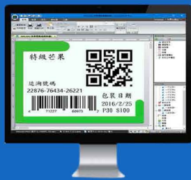
Βήμα 1 - Σχεδίαση