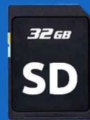
Βήμα 2 Αποθήκευση