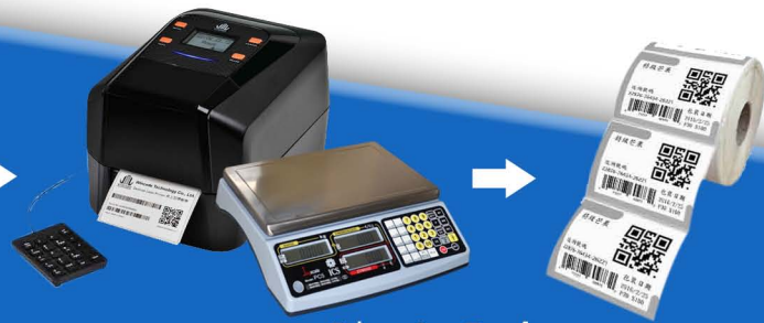
Βήμα 3 - Εκτύπωση